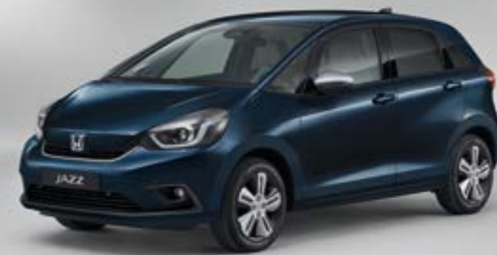
MIDNIGHT BLUE BEAM METALLIC