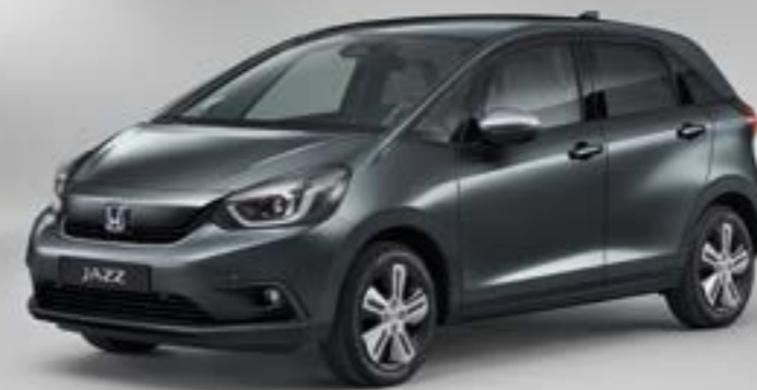
SHINING GRAY METALLIC