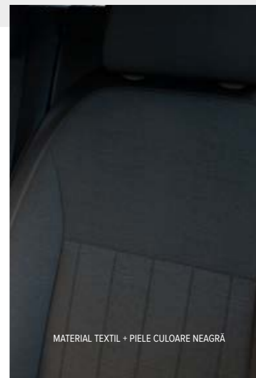
MATERIAL TEXTIL + PIELE CULOARE NEAGRĂ