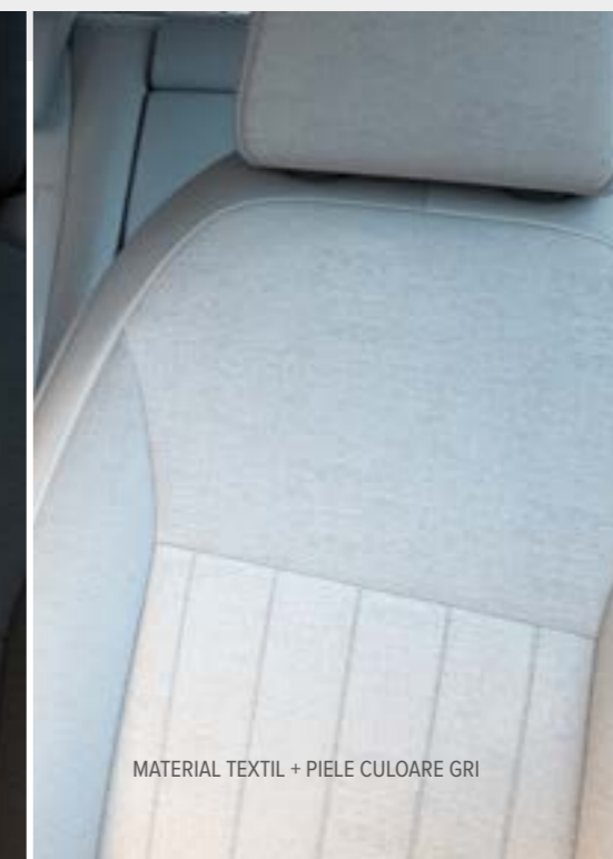
MATERIAL TEXTIL + PIELE CULOARE GRI