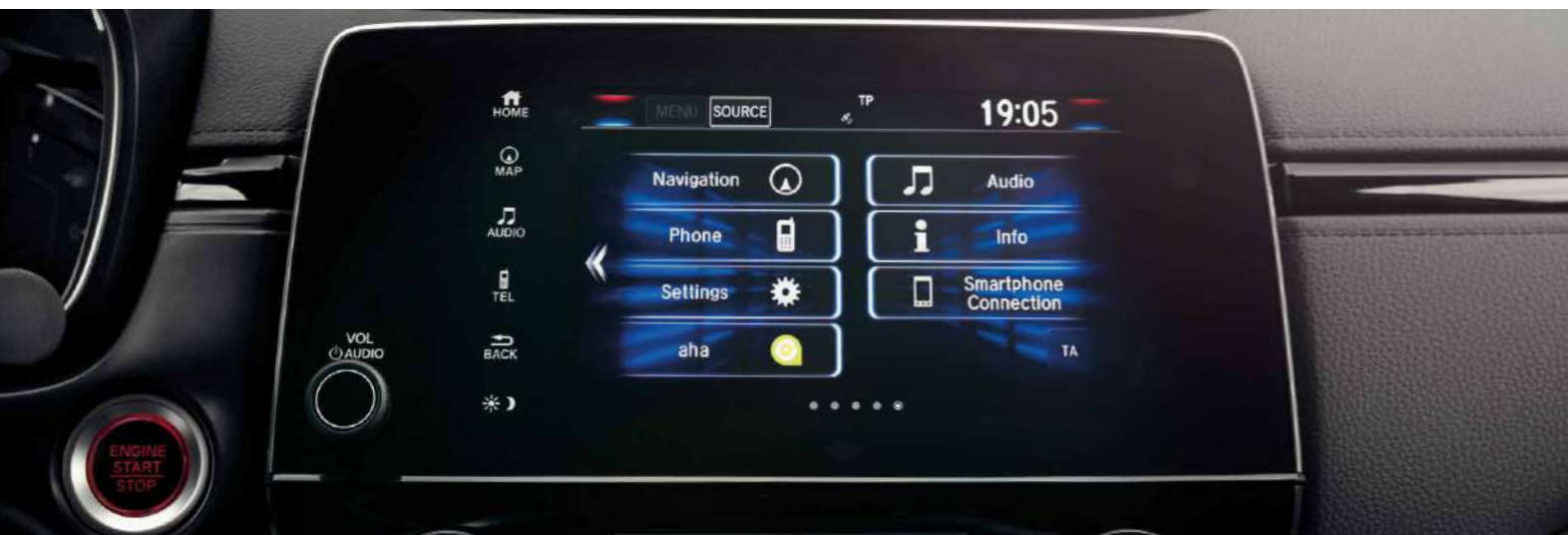
APPLE CARPLAY ȘI ANDROID AUTO™ * Δ

Cuplează în marșarier, iar camera video din spate prinde viața automat pe ecranul de 7" Honda CONNECT.