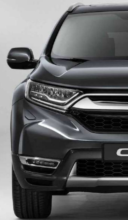
MODERN STEEL METALLIC