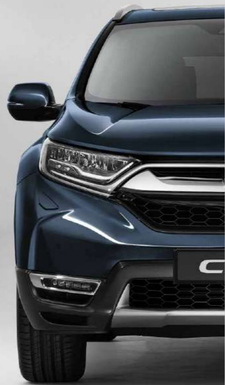
COSMIC BLUE METALLIC