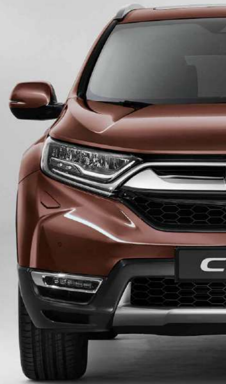
PREMIUM AGATE BROWN PEARL