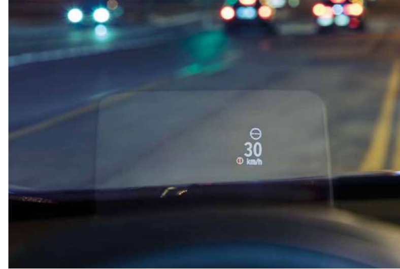
HEAD-UP DISPLAY Δ

Am dezvoltat o gamă largă de tehnologii pentru a face din condusul noului CR-V o experiență cu adevărat încântătoare. Noul sistem de afișare head-up display proiectează informații esențiale în linia ta vizuală, astfel încât să nu ai nevoie să îți iei privirea de la drum. În același timp, datele complete legate de condus sunt afișate în mod clar pe ecranul Intelligent Multi Info Display și pot fi accesate prin comenzile de pe volan. Sistemul de infotainment Honda CONNECT* cu ecran tactil de 7", dispus central, se poate conecta cu ușurință la telefonul tău inteligent, astfel încât să poți accesa aplicații, contacte, e-mailuri și multe altele. Astfel, vei fi conectat în permanență la lumea ta și la lucrurile pe care le iubești.