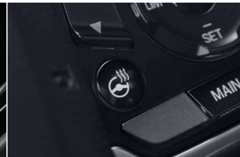
VOLAN ÎNCĂLZIT Δ

Noi credem că oricine călătorește în CR-V ar trebui să se bucure de căldură și confort. De aceea CR-V vine dotat cu scaune față și spate încălzite.