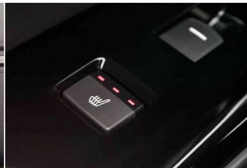
SCAUNE FAȚĂ ȘI SPATE ÎNCĂLZITE Δ

Poți conecta fără probleme telefonul Android sau iPhone-ul tău la sistemul Honda CONNECT, dotat cu ecran tactil de 7", ceea ce îți permite să efectuezi apeluri telefonice, să asculți muzică sau să trimiți și să primești mesaje.