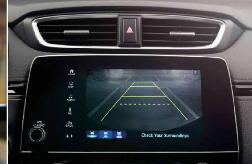
CAMERĂ VIDEO PENTRU MERS ÎNAPOI Δ

Ecranul head-up display proiectează informații utile astfel încât șoferul să le poată vedea fără a fi nevoit să-și abată privirea de la drum.