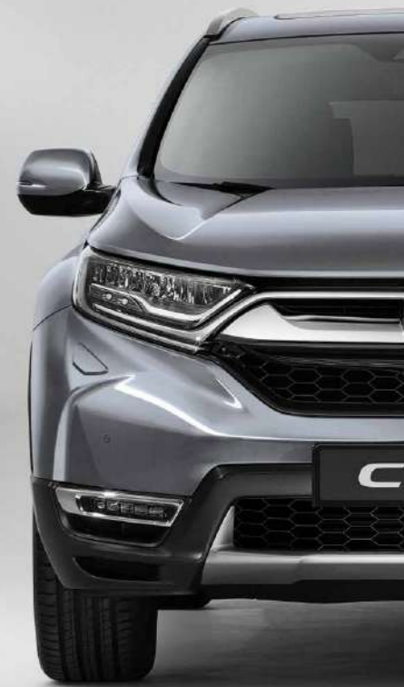
LUNAR SILVER METALLIC