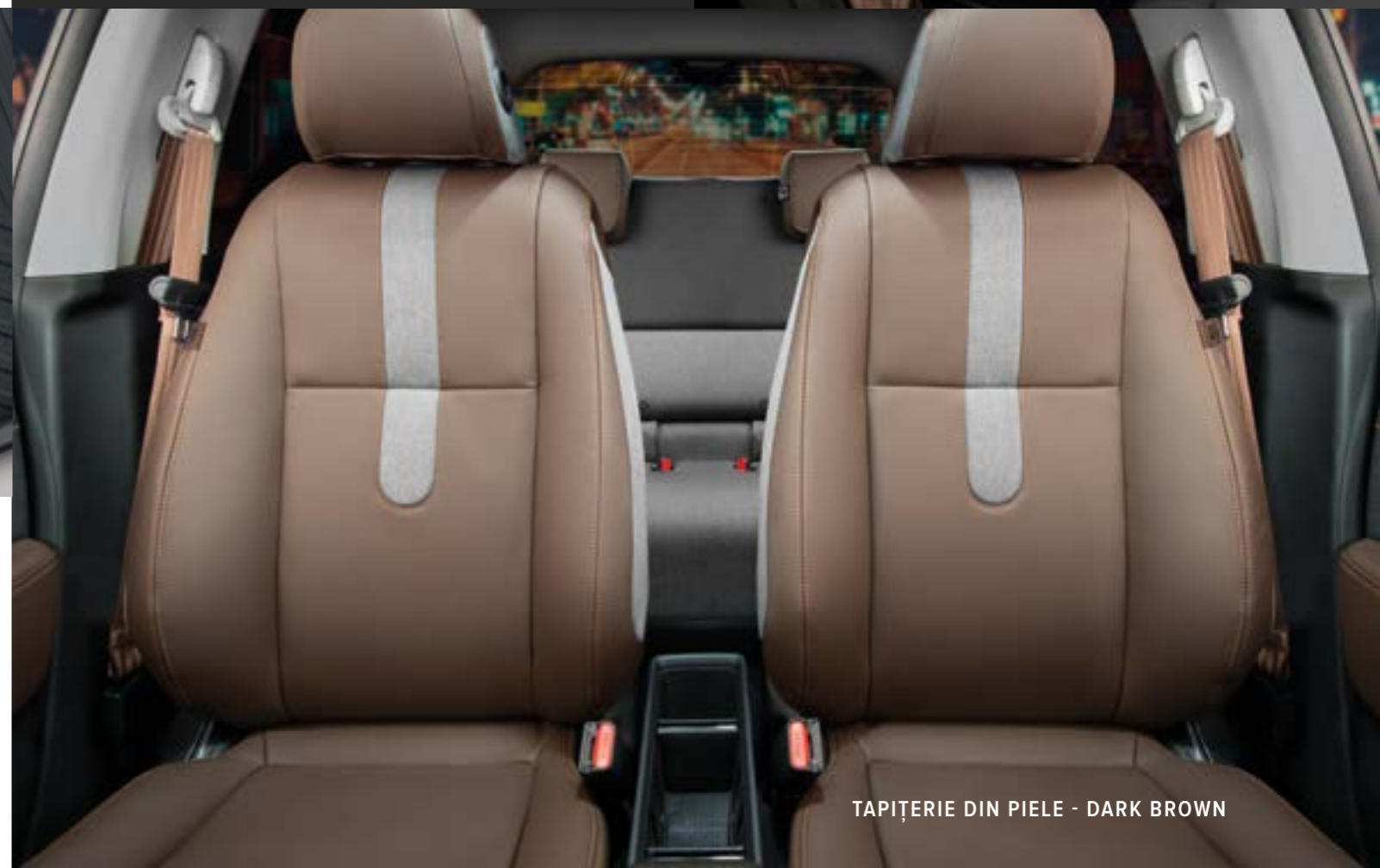
TAPIȚERIE DIN PIELE - DARK BROWN

Acest pachet conferă protecție maximă mașinii tale. Pachetul include: Protecție portbagaj reversibilă, covorașe din cauciuc față și spate, husă pentru portul de încărcare și bandă pentru protecția portului de încărcare.