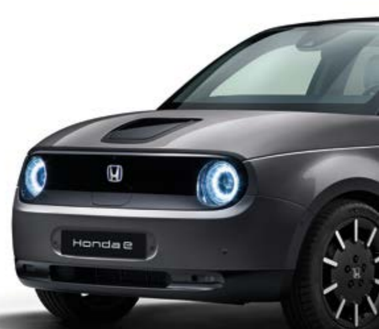
MODERN STEEL METALLIC