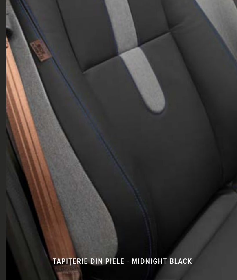
TAPIȚERIE DIN PIELE - MIDNIGHT BLACK

Această tapițerie autentică este garantată de calitatea de producție integrată Honda, durabilitatea și finisarea premium.