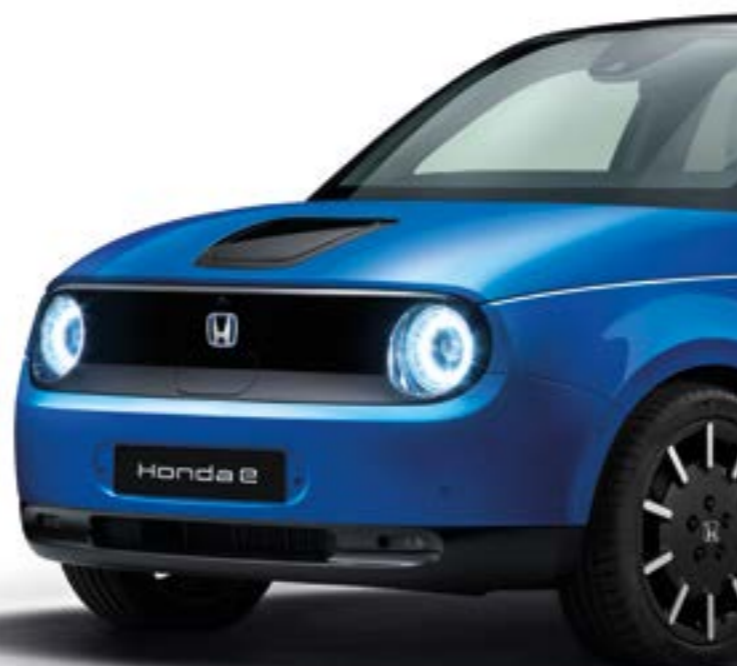
PREMIUM CRYSTAL BLUE METALLIC