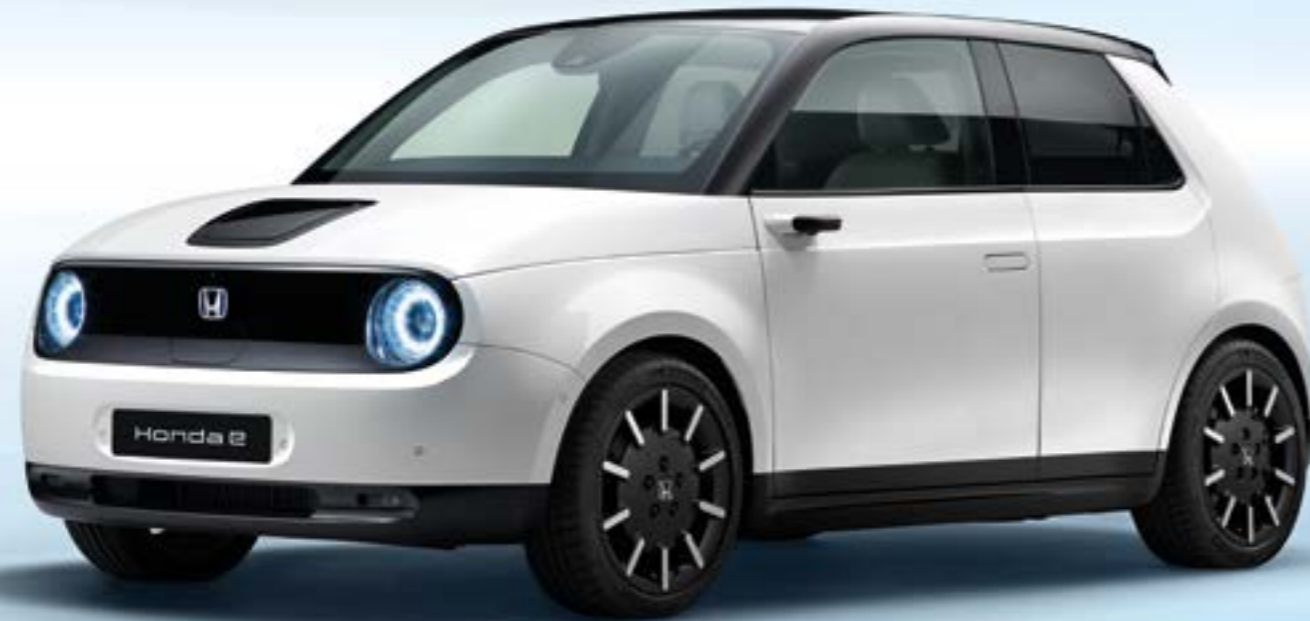
Modelul din imagine este Honda e Advance, culoarea Platinum White Pearl.