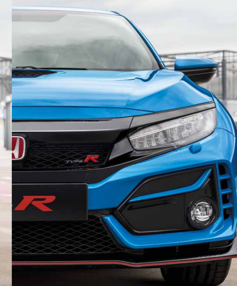
RACING BLUE PEARL