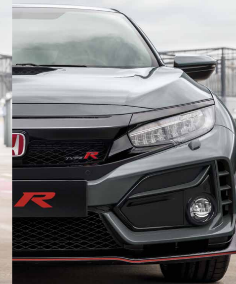
POLISHED METAL METALLIC