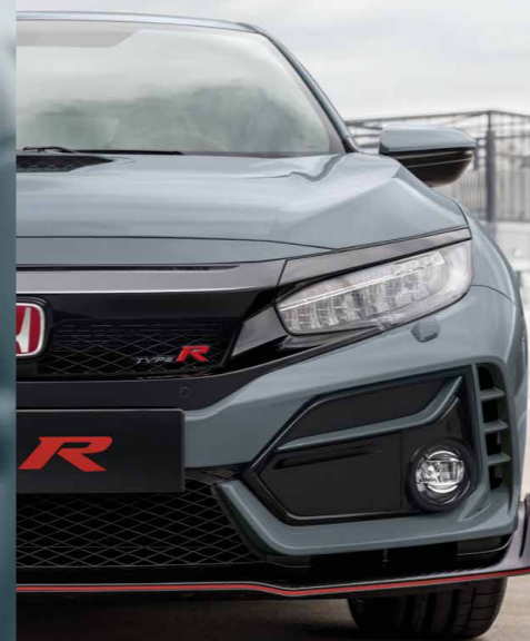
SONIC GREY PEARL