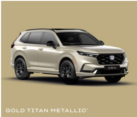
GOLD TITAN METALLIC*