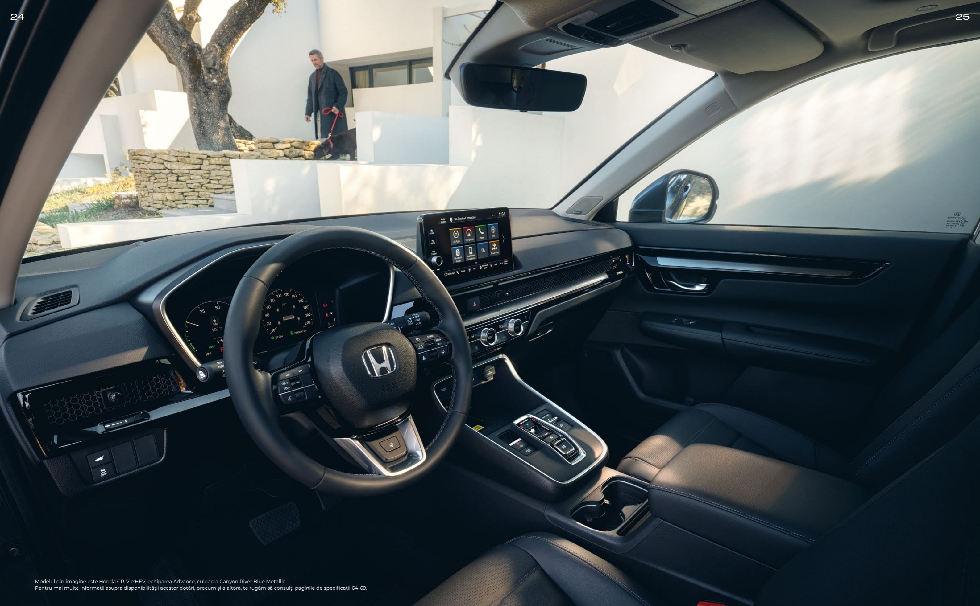
Modelul din imagine este Honda CR-V e-HEV, echiparea Advance, culoarea Canyon River Blue Metallic. Pentru mai multe informații asupra disponibilității acestor dotări, precum și a altora, te rugăm să consulți paginile de specificații 64-69.