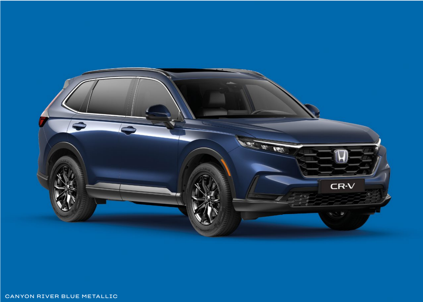
CANYON RIVER BLUE METALLIC

Alege dintr-o gamă de culori contemporane care reflectă personalitatea ta și designul dinamic al noului CR-V.