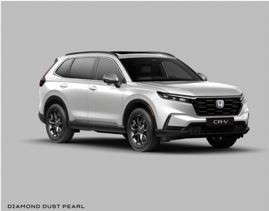
DIAMOND DUST PEARL