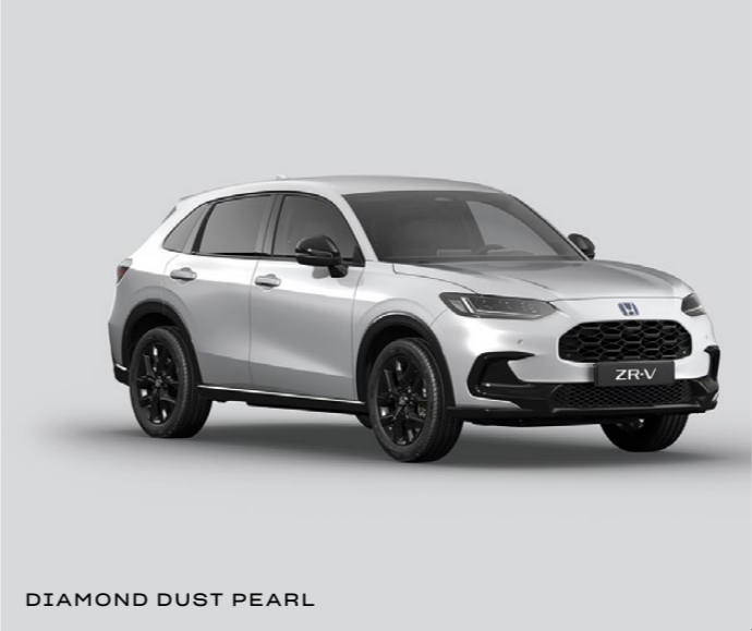
DIAMOND DUST PEARL