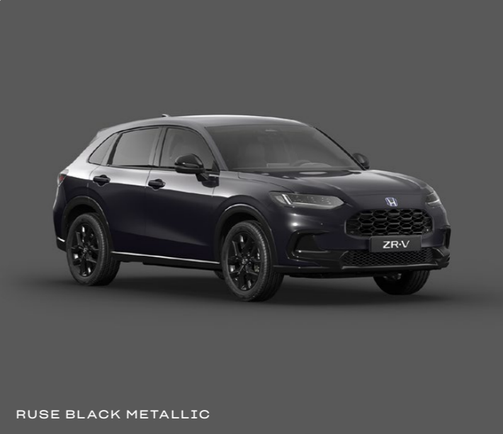
RUSE BLACK METALLIC