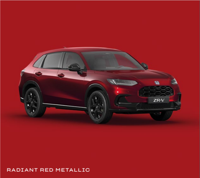
RADIANT RED METALLIC