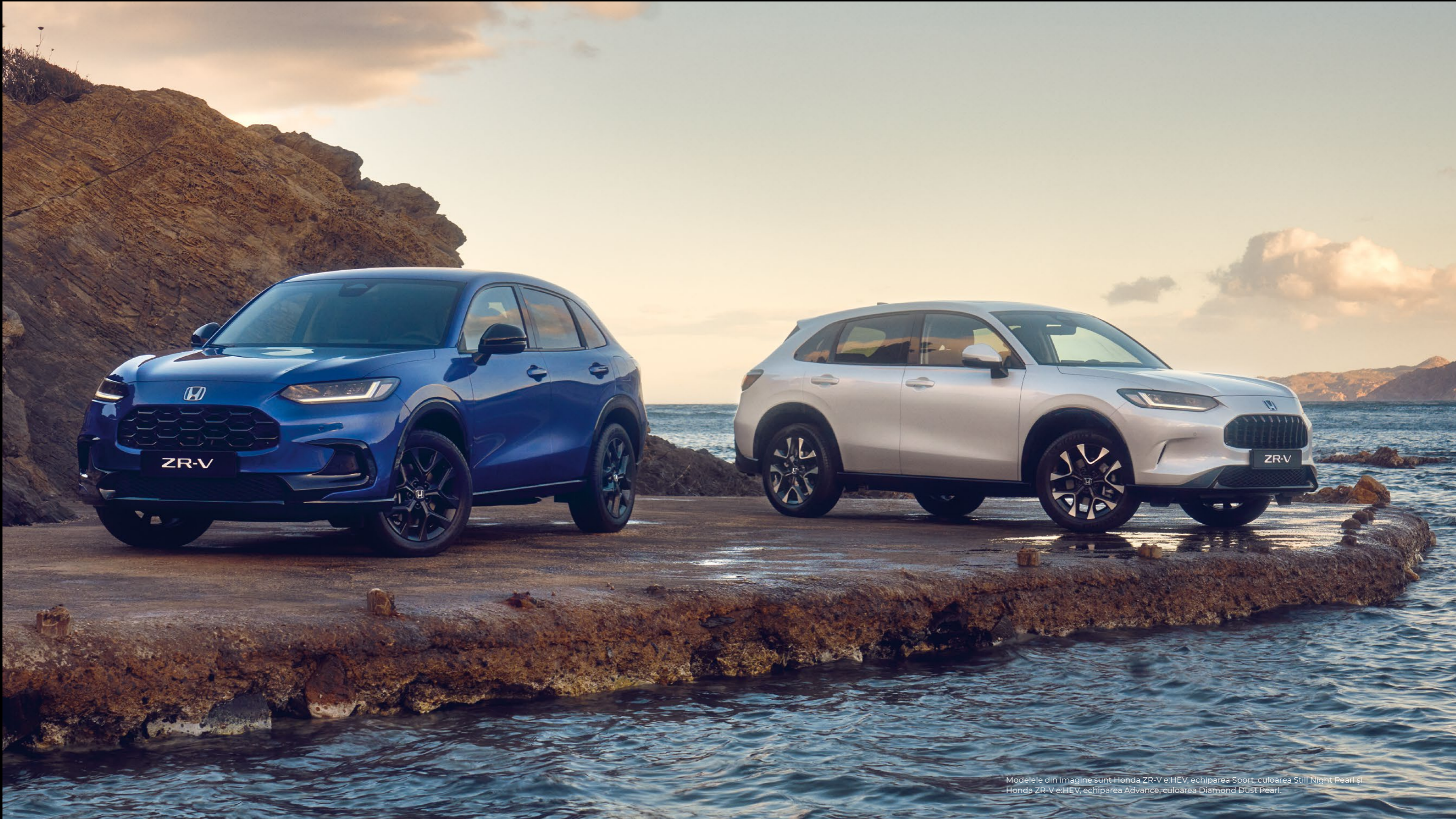
Modelele din imagine sunt Honda ZR-V e:HEV, echiparea Sport, culoarea Still Night Pearl și Honda ZR-V e:HEV, echiparea Advance, culoarea Diamond Dust Pearl.