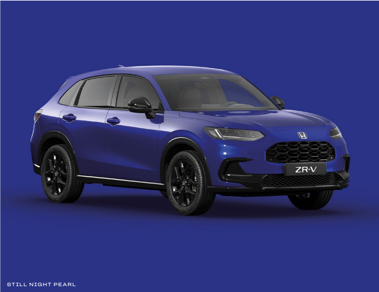
STILL NIGHT PEARL

Alege dintr-o gamă de culori contemporane care reflectă personalitatea ta și stilul dinamic al modelului ZR-V.