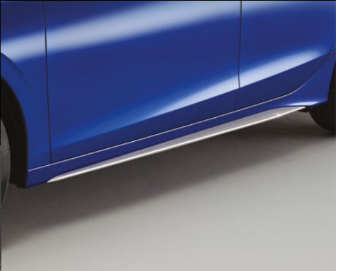
ORNAMENTE LATERALE Creează un detaliu suplimentar clar prin adăugarea acestor ornamente laterale.