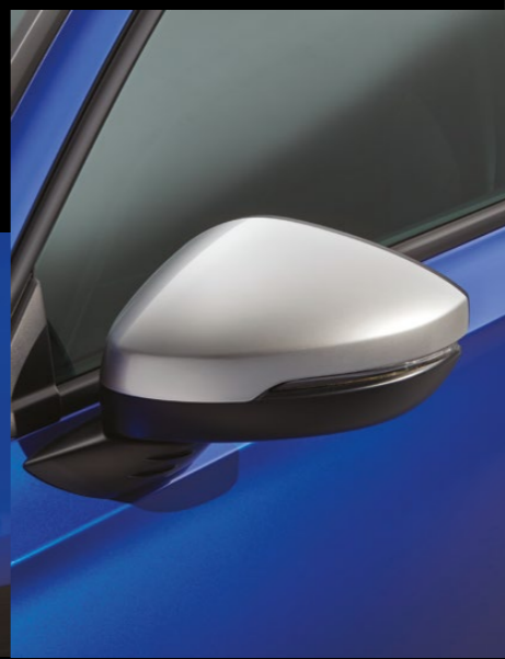
CAPACE PENTRU OGLINZILE LATERALE Continuă tema Nordic Silver asortând aceste capace pentru oglinzile laterale.