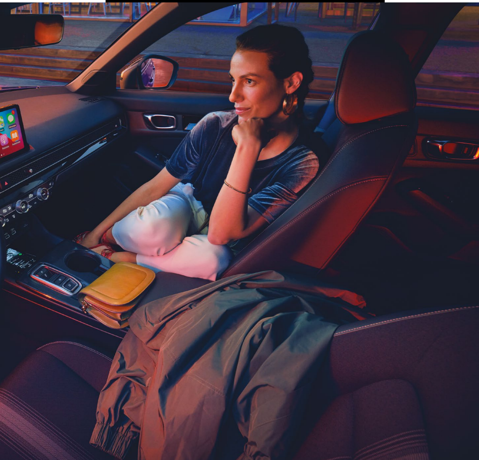
Modelul din imagine este Honda Civic e:HEV, echiparea Sport, culoarea Premium Crystal Blue Metallic. Pentru mai multe informații asupra disponibilității acestor dotări, precum și a altora, te rugăm să consulți paginile de specificații 78-83.