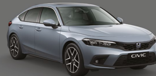
SONIC GREY PEARL