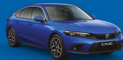
PREMIUM CRYSTAL BLUE METALLIC