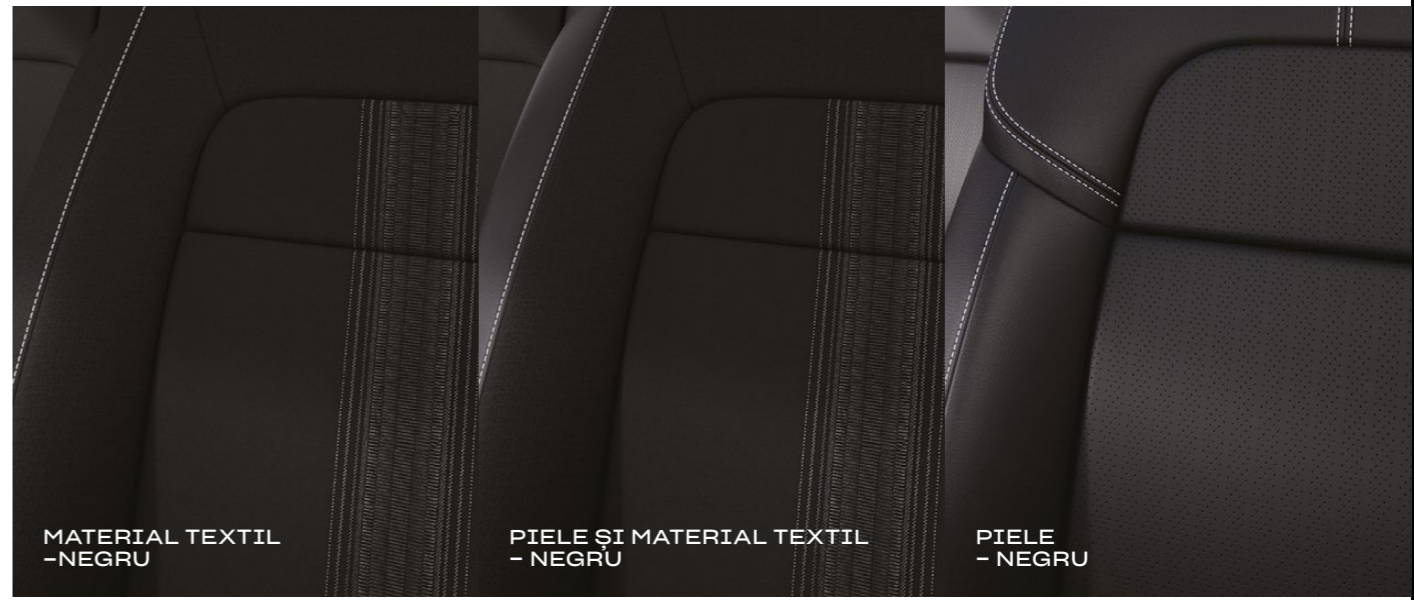
MATERIAL TEXTIL - NEGRU