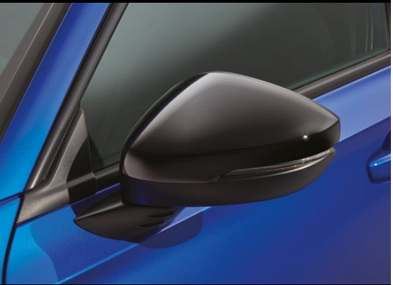
ORNAMENTE LATERALE - PARTEA DE JOS Aceste ornamente laterale Berlina Black dau un aspect athletic mașinii tale.