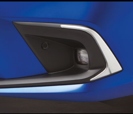
ORNAMENTE PENTRU PROIECTOARELE DE CEAȚĂ Finisajul argintiu pentru proiectoarele de ceață creează un detaliu clar și remarcabil, sporind perfect aspectul frontal al Civic-ului tău.