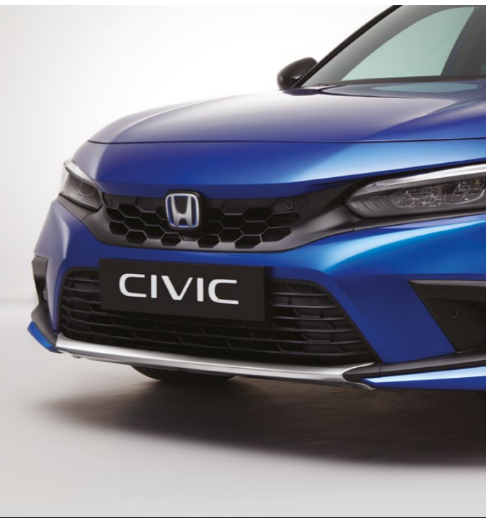
ORNAMENTE FAȚĂ ȘI SPATE Ornamentele față și spate adaugă o semnătură metalică elegantă profilului mașinii.